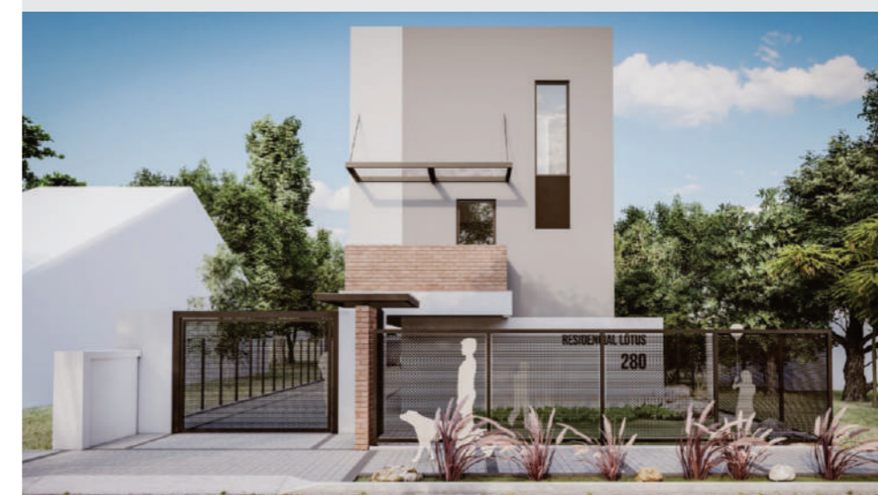
RENDERS DO EMPREENDIMENTO IMAGENS ILUSTRATIVAS