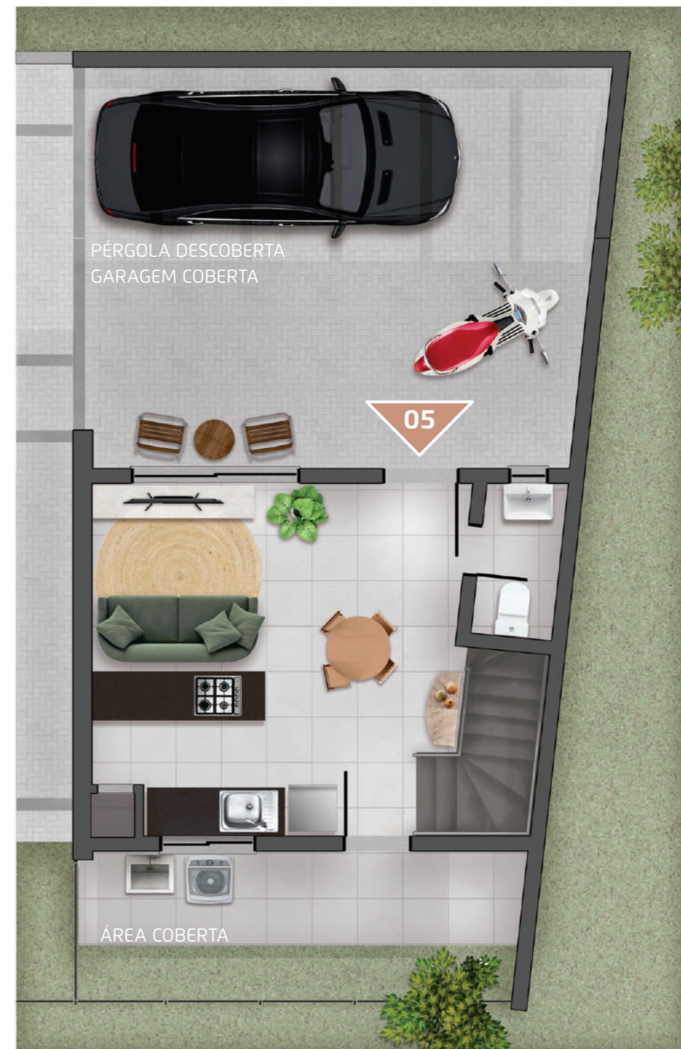
TÉRREO / ACESSOS PLANTA HUMANIZADA ILUSTRATIVA