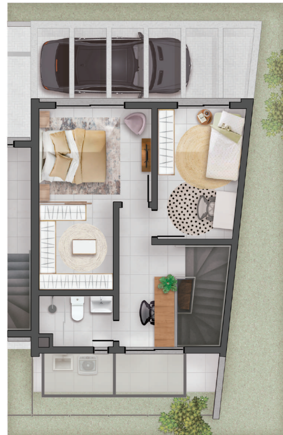
2º PAVIMENTO / ACESSOS PLANTA HUMANIZADA ILUSTRATIVA