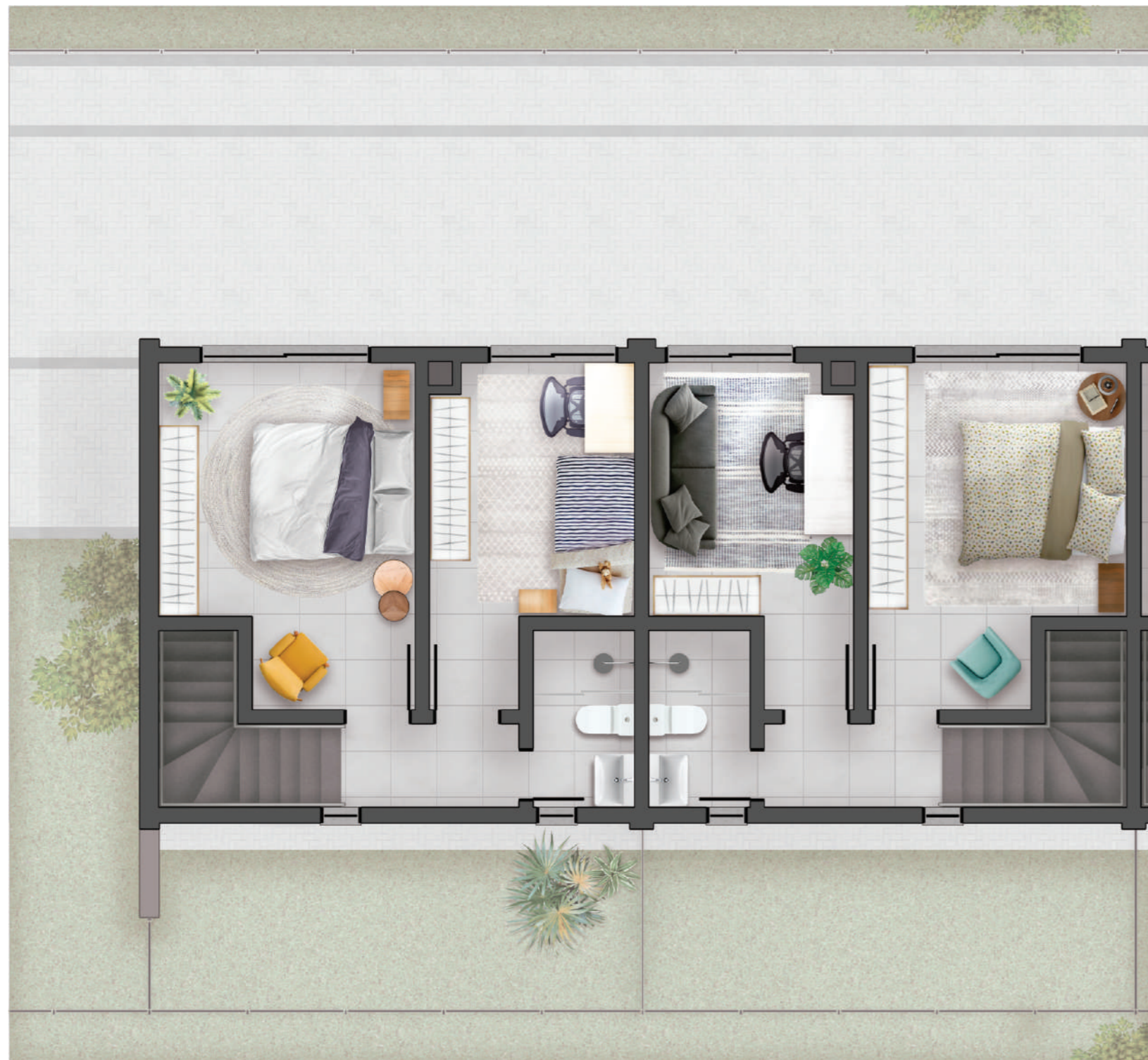
3° PAVIMENTO PLANTA HUMANIZADA ILUSTRATIVA